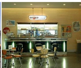
Haus der Geschichte