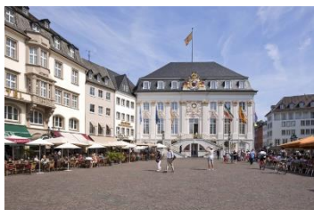
Altes Rathaus Bonn